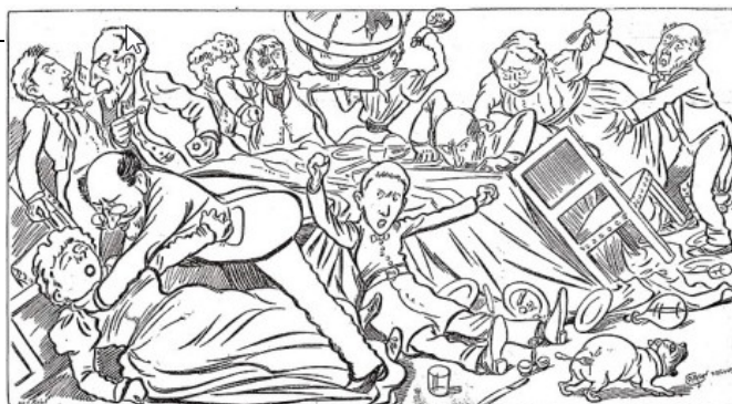
Ils en ont parlé