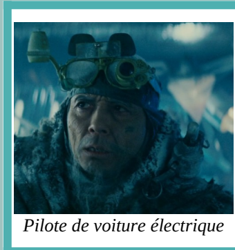
Pilote de voiture électrique

Si un agent téméraire tente de faire l'aller-retour jusqu'à Clermont, il faudra prévenir la presse, la télé, les youtubeur... Il y a eu Louis Blériot, il y aura cet agent.