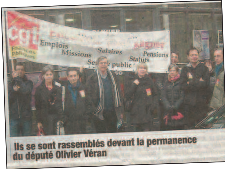
Ils se sont rassemblés devant la permanence du député Olivier Véran