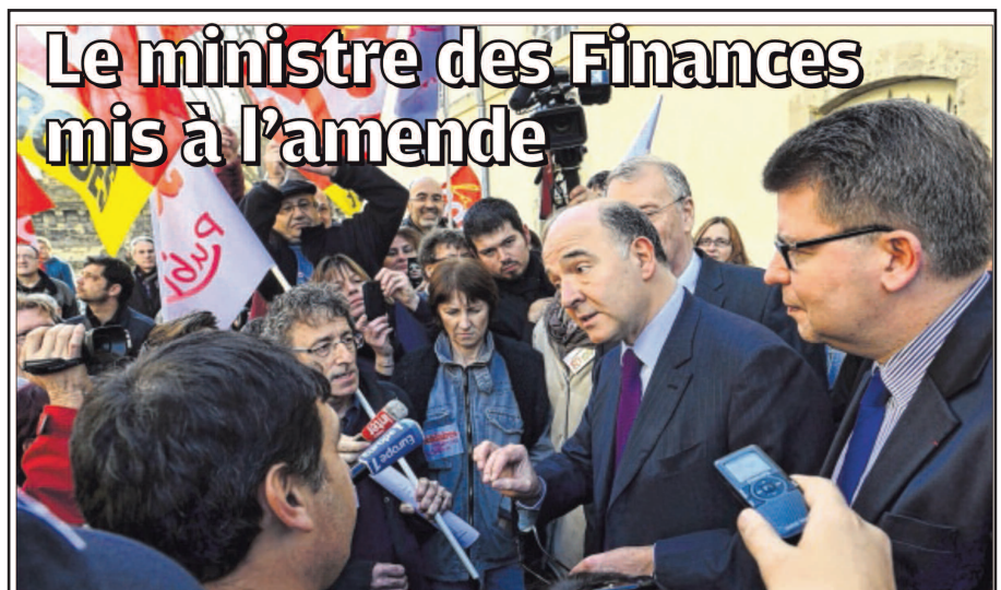
AVIGNON Venu notamment annoncer la vente sur internet, dès 2014, des timbres fiscaux pour les passeports, Pierre Moscovici a dû essuyer la colère de syndicats de l'administration des Finances publiques, inquiets pour l'emploi et les salaires.