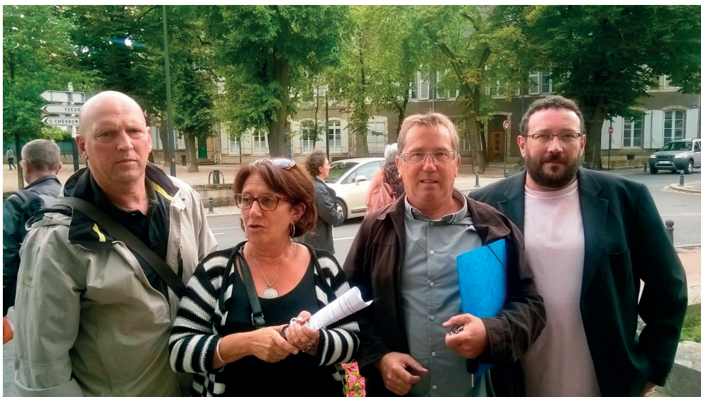
La délégation CGT devant la Préfecture