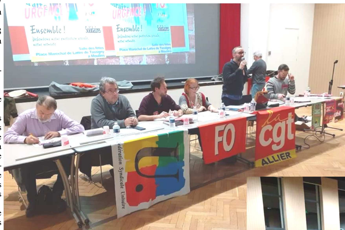
Débat public Moulins

les élus de la majorité sont en difficulté pour venir « vendre » la réforme des retraites à points de Macron.