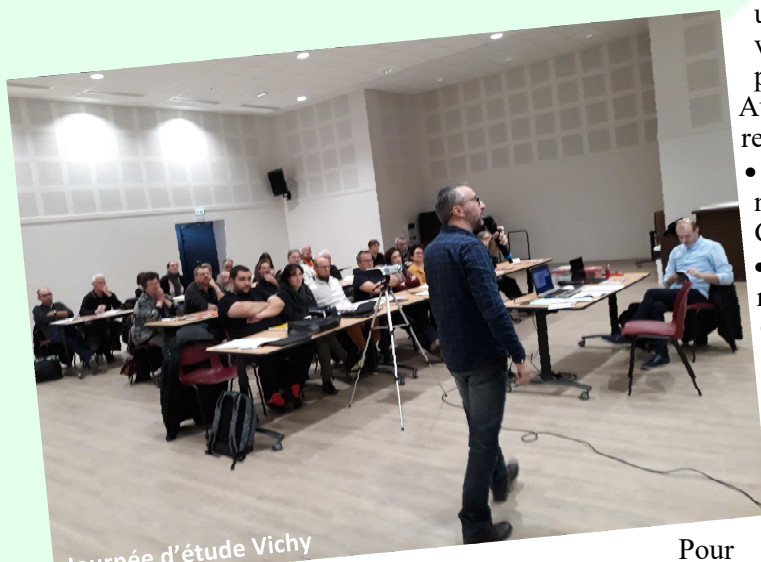
Journée d'étude Vichy