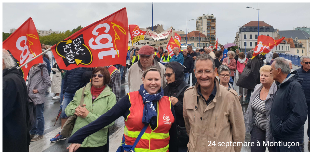
24 septembre à Montluçon