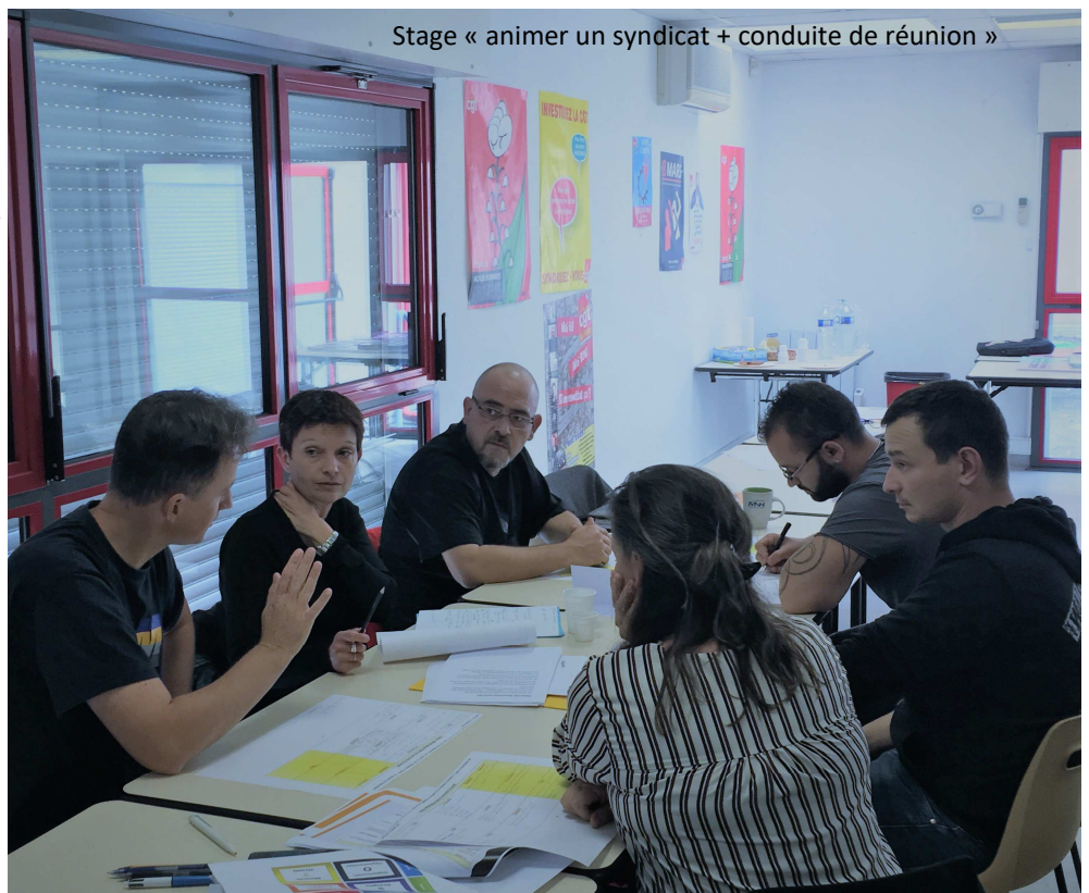
Stage « animer un syndicat + conduite de réunion »

Ce stage développe l'histoire du mouvement ouvrier et syndical. Il aborde également la création des syndicats et l'historique des luttes jusqu'à aujourd'hui.