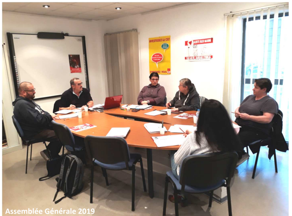
Assemblée Générale 2019